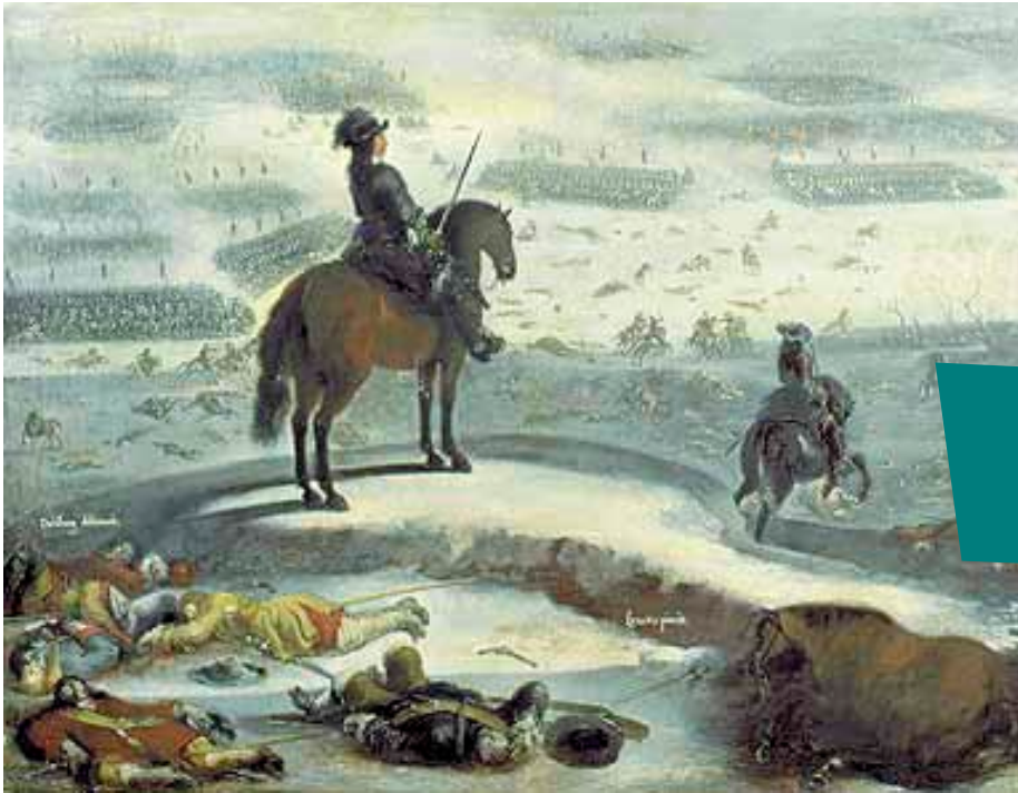
KUVA 27. Sotaretki Ison-Beltin yli 1685. Kaarle X Kustaa katsoo jälle.